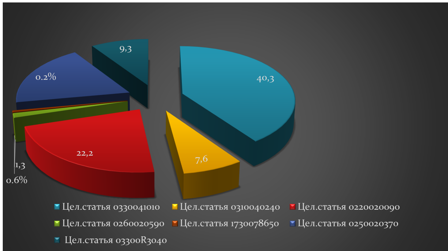
Рис.3 Распределение субсидий на иные цели по целевым статьям в % соотношении: